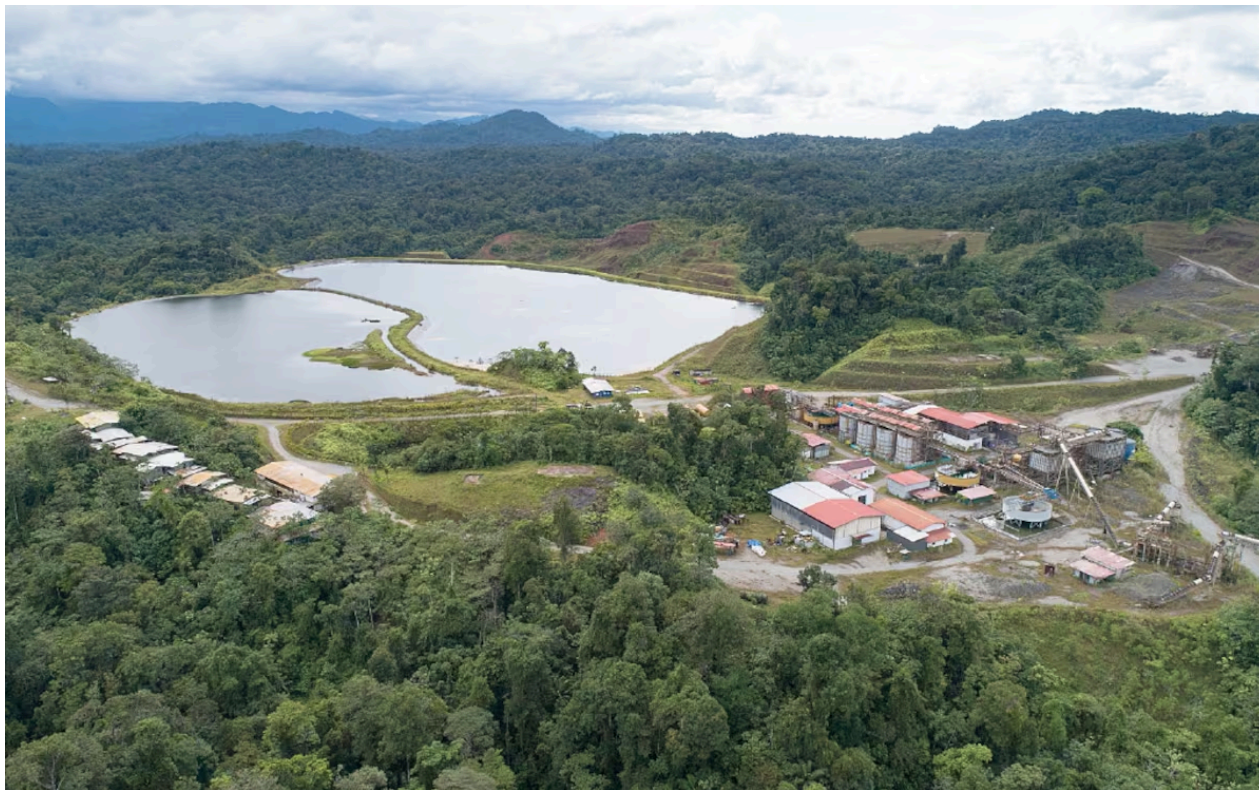
El proyecto minero Molejón, bajo la responsabilidad de Petaquilla Gold, cesó sus operaciones en 2014. LP Alexander Arosemena